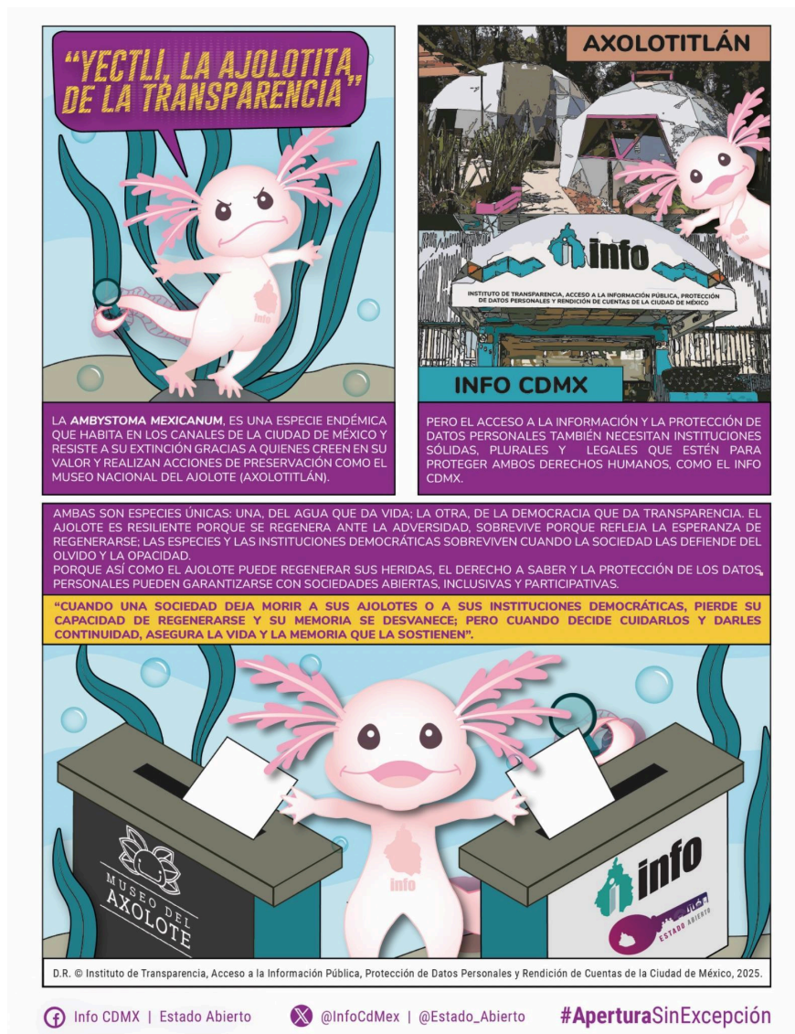
Ilustración 1. Cómic de Yectli