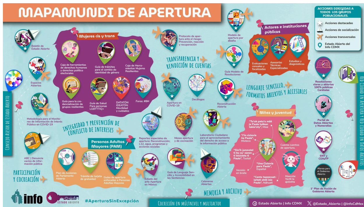
Ilustración 2. Mapamundi de Apertura