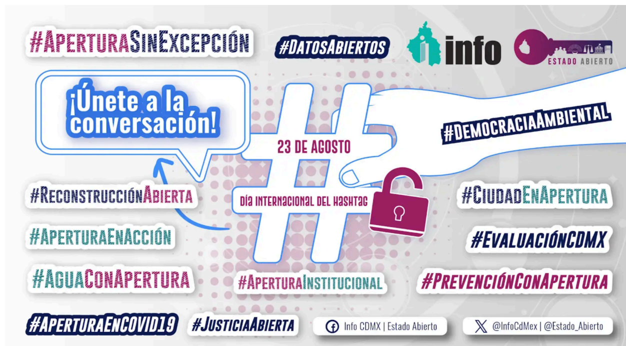
Ilustración 3. Día Internacional del Hashtag

Este año continuamos con la dinámica de años anteriores con el aprovechamiento de visibilización de la agenda de apertura y del derecho a saber en fechas conmemorativas, Destacan el día internacional de la Tolerancia, Día internacional de la persona periodista Banner - de la Protección de los Datos Personales, Día Internacional de las niñas en las TICS Banner - Día Mundial de la Libertad de prensa, Día de las niñas y los niños, Día Mundial de las Telecomunicaciones y de la Sociedad de la Información Banner, Día Internacional de Hashtag, Día Internacional de la paz , Día Universal del Derecho de Acceso a la Información Banner - y el Día Internacional para la erradicación para la pobreza.